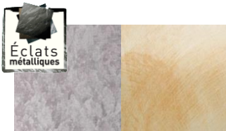
L'aspect des métaux vieillis par le temps