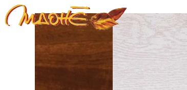
L'aspect du bois et la tranquillité de l'aluminium